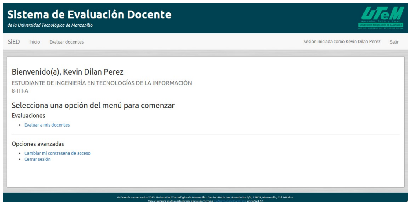
Figura 2: Pantalla de inicio de estudiantes

Cuando un estudiante inicia sesión en el SIED, lo primero que verá es la pantalla de inicio de estudiantes . Esta pantalla proporciona accesos a los aspectos del SIED que pueden usar los estudiantes de la universidad.